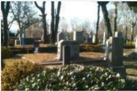
Algunas de las 145 tumbas del Cementerio Yanghwajin de Misioneros Extranjeros, Seúl

“Ciertamente les aseguro que si el grano de trigo no cae en tierra y muere, se queda solo. Pero si muere, produce MUCHO fruto.” (Juan 12:24, NVI, con emphasis agregado).