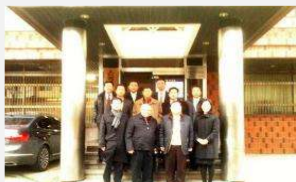
Departamento de Misiones, Asambleas de Dios de Corea