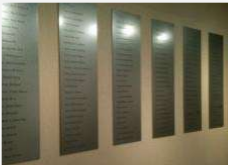
Las 145 placas con nombres en el museo

Hay un tributo a Juan 12:24 en el museo: “Ciertamente les aseguro que si el grano de trigo no cae en tierra y muere, se queda solo. Pero si muere, produce MUCHO fruto”.