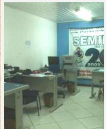
Las simples oficinas de SEMIPA, donde trabajan 5 personas a tiempo completo. Más de 80 misioneros son enviados desde aquí hacia 20 países.

Una vista de noche de las 3000 persona que asistieron a la convención de misiones en Municipal Government Campground.