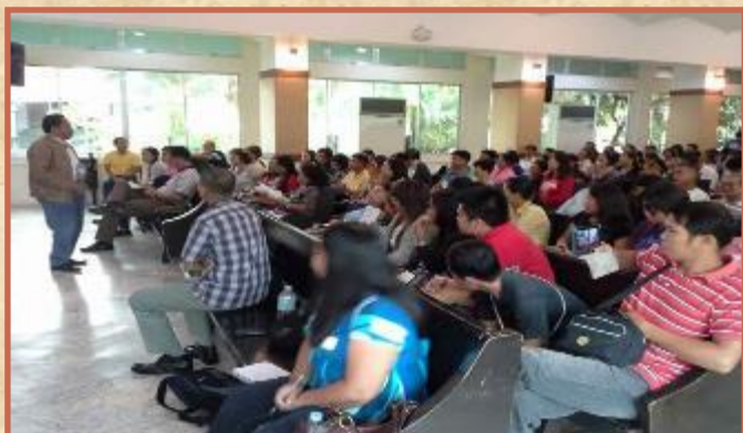
Evento Distrital de Misiones

necesidad del campo deben ser entrelazados en nuestra asociación. Veo nuestro avance como una guerra que tenemos que coordinar más allá de nuestra tradición y de ser indígenas como iglesia o país. Un país tiene una gran cantidad de fondos y experiencia; otro tiene una gran cantidad de trabajadores, pero menos fondos o experiencia. ¿Hemos pensado en la asociación más allá de las tradiciones normales? La necesidad de las misiones es enorme. Como una niña de Lao una vez me dijo en Laos comunista después de que yo le di un tratado evangelístico: "Ha sido un año que he querido oír hablar de Jesús de nuevo .... La primera vez que oí hablar de Jesús era de una transmisión de radio desde Tailandia. Yo quería escuchar, pero nunca escuché de nuevo. Esperé durante un año, pero sólo hasta ahora, lo escuché de nuevo."