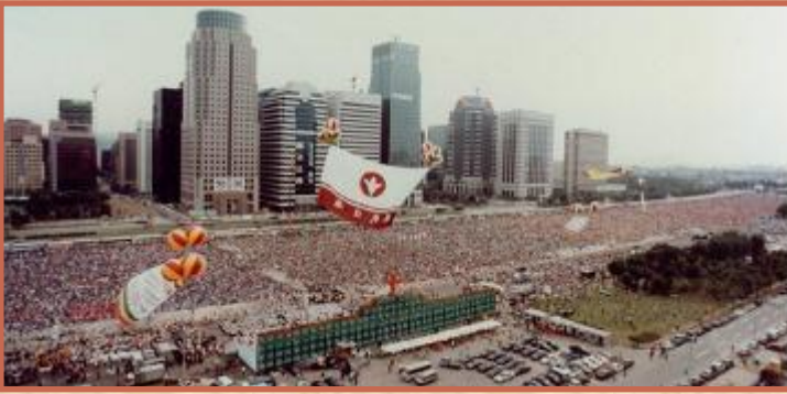
Vista del Primer Congreso WAGF, 1994, Seoul, Corea del Sur