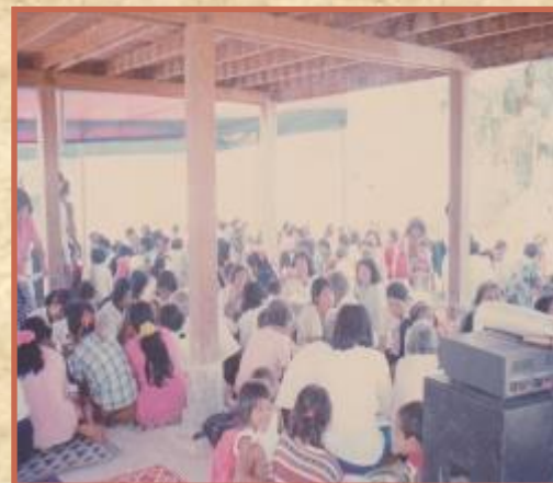
Creyentes en una iglesia pionera

Si cierro los ojos, puedo ver los misioneros filipinos en aldeas, pueblos o ciudades donde el Evangelio no ha sido predicado. Puedo verlos viviendo en lugares que llamarán su hogar. Comer con las personas que llamarán familia. Jugar con los niños del pueblo que tratarán como si fueran suyos. Oren con ellos, lloren con ellos, y adoraren al Señor con ellos, amaos hasta que Dios los lleve a su hogar celestial.