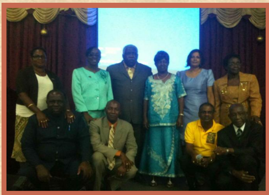
Os Pastores e suas esposas que organizaram e participaram do Evento deste ano.