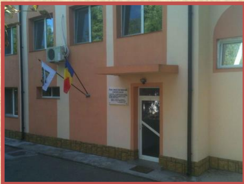
El Centro De Estudios Multiculturales de Rumania (CRST), una escuela para el entrenamiento a las misiones