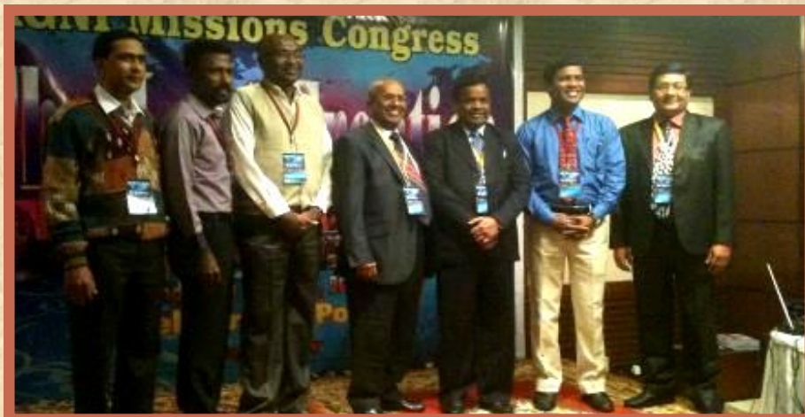
Entre alguns líderes no Congresso.