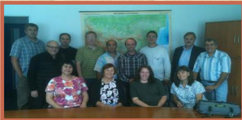
Os lideres que se reuniram para a planificação e consulta em setembro.

R: Jesus afirmou: “ A colheita e abundante, mais os obreiros são poucos – disse a seus discípulos – importante, portanto , que o Senhor da messe envie obreiros ao campo “. (MT 9:37-38). O mais importante é o chamado de Deus aos obreiros da colheita, quando Deus chame as pessoas do nosso país para Sua colheita, devemos estar prontos para enviar e sustentar eles.