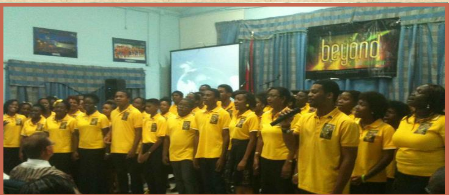
O coro de cem vozes de quatro Igrejas foi um ponto a destacar na Convenção.