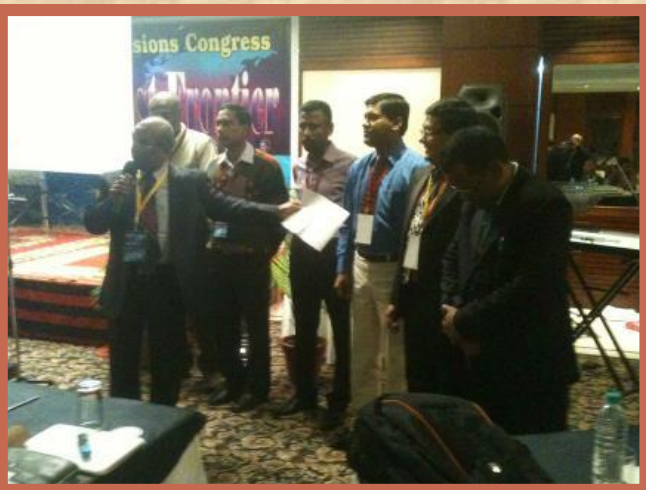
A presença da Comissão de Missões