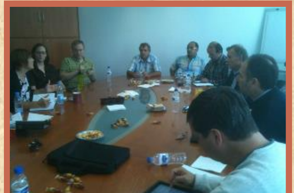
Parte do grupo reunido em 20 de setembro, 2013.