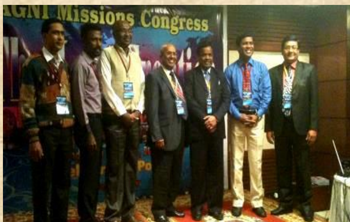
Некоторые из лидеров на Конгрессе