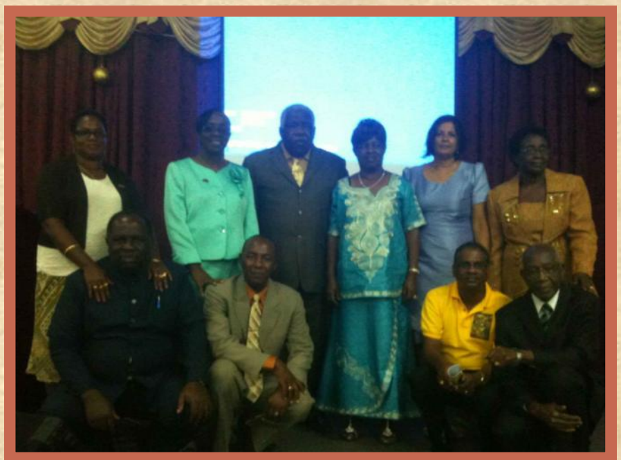
Пасторы и супруги, организовавшие и принимавшие участие в конференции этого года