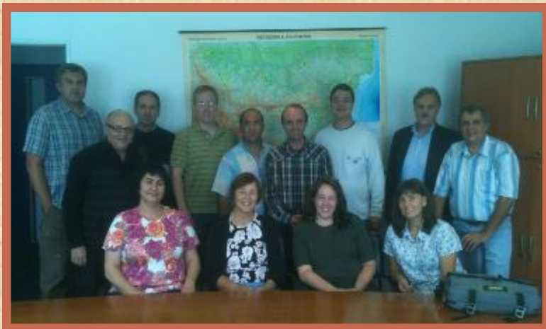
Лидеры, собравшиеся для планирования и консультаций в сентябре

Иисус сказал: "Жатвы много, а работников мало. Итак, молитесь Господина жатвы, чтобы выслал работников на жатву Свою" (Матфея 9:37-38). Самое важное - это Божий призыв работников к сбору жатвы. Когда Бог призывает людей из нашей страны на Его жатву, мы должны быть готовы посылать и поддерживать их.