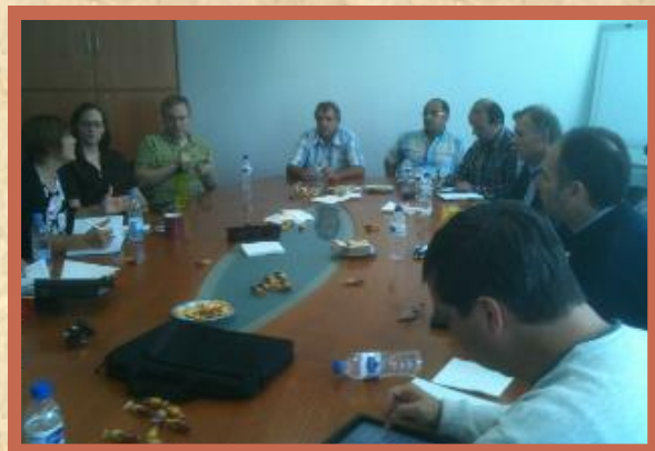
Часть группового собрания 20 сентября 2013