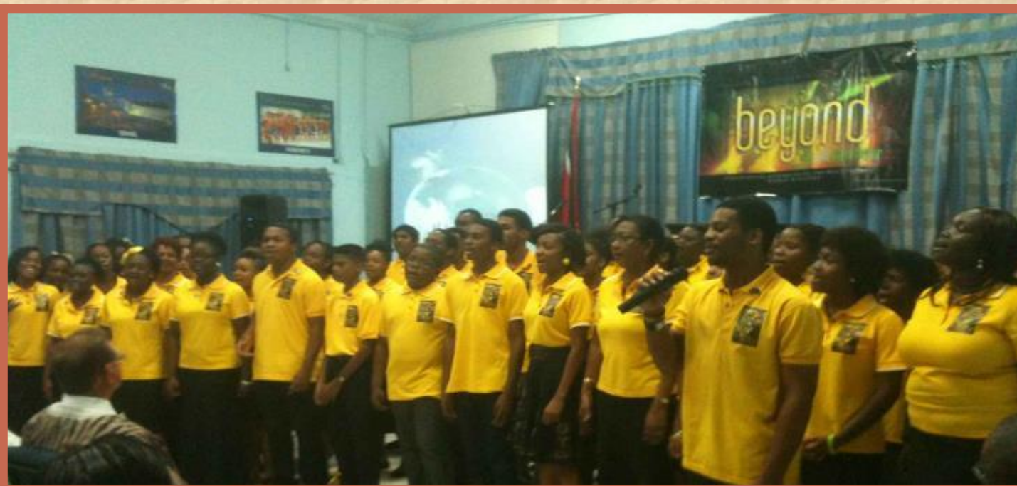
Хор из 100 голосов с четырех церквей стал ярким моментом конференции