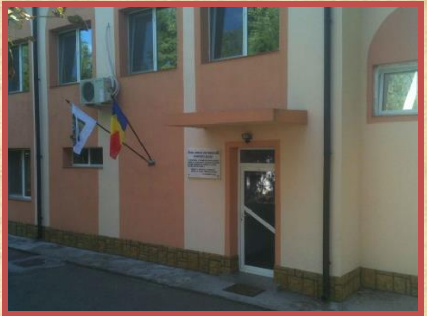
El Centro De Estudios Multiculturales de Rumania (CRST), una escuela para el entrenamiento a las misiones