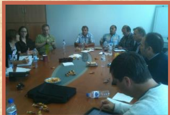
Parte del grupo reunido el 20 de septiembre, 2013