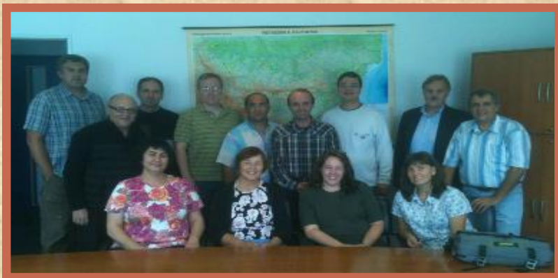
Los líderes que se reunieron para la planificación y consulta en septiembre

R: Jesús dijo, “La cosecha es abundante, pero son pocos los obreros —les dijo a sus discípulos—. Pídanle, por tanto, al Señor de la cosecha que envíe obreros a su campo.”(Mateo 9:37-38, NVI). Lo mas importante es el llamado de Dios a los obreros de la cosecha. Cuando Dios llame a las personas de nuestro país para Su cosecha, debemos estar listos para enviarlos y sostenerlos.