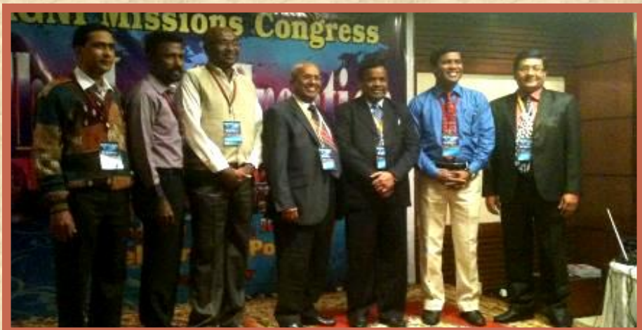
Algunos líderes en el congreso